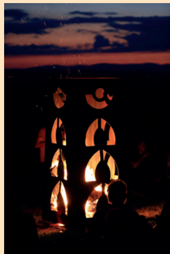
"Zum Himmel her" Skulptur von Bildhauer Volker Scheurer am Eingang des Weinweges in Weil am Rhein